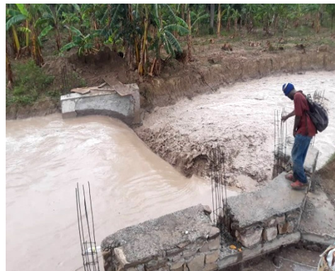
Der ersehnte Regen Mitte Juni... Die Überschwemmung ist gebannt! An dieser Stelle fliesst ein Grossteil des Wassers links und rechts in die Nebenanäle

Nordwesten: LAKOMA Das Drainageprogramm des letzten Jahres erhält noch den letzten Schliff. Hier kann gearbeitet werden!