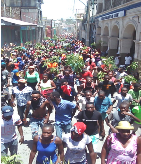
Seit einem Jahr wird in Haiti demonstriert. Dies nicht nur in der Hauptstadt. Auch alle Provinzstädte sind in Aktion, wie hier in Jérémie im Süden

„ Gärten lehren leben “. So heisst das Motto der 23 Schulgärten, die Hand in Hand begleitet. Die theoretische Schulung Agro-Ökologie genügt nicht. Es geht ums Hand-Anlegen, Bearbeiten des Bodens, Bepflanzen, Giessen, Jäten, Ernten und Verkaufen oder Konsumieren.