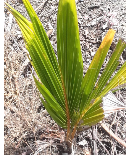
Nicht nur Kokospalmen wie auf diesem Bild, sondern auch Moringa, Brotfrucht, Mango und 9 weitere Baumarten wurden bereits gepflanzt