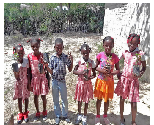
Schülerinnen und Schüler nehmen die Bäumchen auch mit nach Hause und pflanzen und pflegen sie im Familiengarten