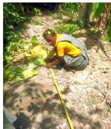
Wieviel Abstand brauchen die Bäume? Diese Schülerin lernt mit dem Messband Mathematik